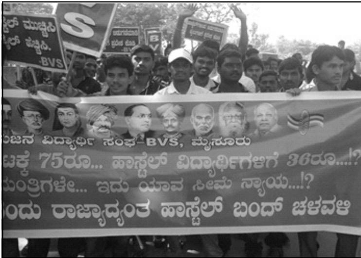
ಪ್ರತಿಭಟನೆಯಲ್ಲಿ ಸಾಗುತ್ತಿರುವ ಬಹುಜನ ವಿದ್ಯಾರ್ಥಿ ಸಮೂಹ

ಮಾನಸಗಂಗೋತ್ರಿ ಆವರಣದಿಂದ ಭಾರೀ ವೆರವಣಿಗೆಯು ಕುಕ್ಕರಹಳ್ಳಿ, ಸರಸ್ವತಿಪುರಂ ಮಾರ್ಗವಾಗಿ ಸಂಚರಿಸಿ ಜೆಎಲ್ಬಿ ರಸ್ತೆ ಮೂಲಕ ಮಹಾರಾಜ ಕಾಲೇಜು, ಮಹಾರಾಣಿ ಕಾಲೇಜು ಮಾರ್ಗದಲ್ಲಿ ಸಾಗಿ ಜಿಲ್ಲಾಧಿಕಾರಿ ಕಚೇರಿ ತಲುಪಿತು. ಈ ಮಧ್ಯೆ ರಾಮಸ್ವಾಮಿ ವೃತ್ತದಲ್ಲಿ ಮಾನವ ಸರಪಳಿ ನಿರ್ಮಿಸಿದ ವಿದ್ಯಾರ್ಥಿಗಳು ಸರ್ಕಾರದ ವಿರುದ್ಧ ಘೋಷಣೆ ಕೂಗಿದರು. ರಾಜ್ಯದಲ್ಲಿ ಎಸ್‌ಸಿ-ಎಸ್‌ಟಿ, ಓಬಿಸಿ ಮತ್ತು ಅಲ್ಪಸಂಖ್ಯಾತ ಇಲಾಖೆಗಳಿಗೆ ಸೇರಿದ