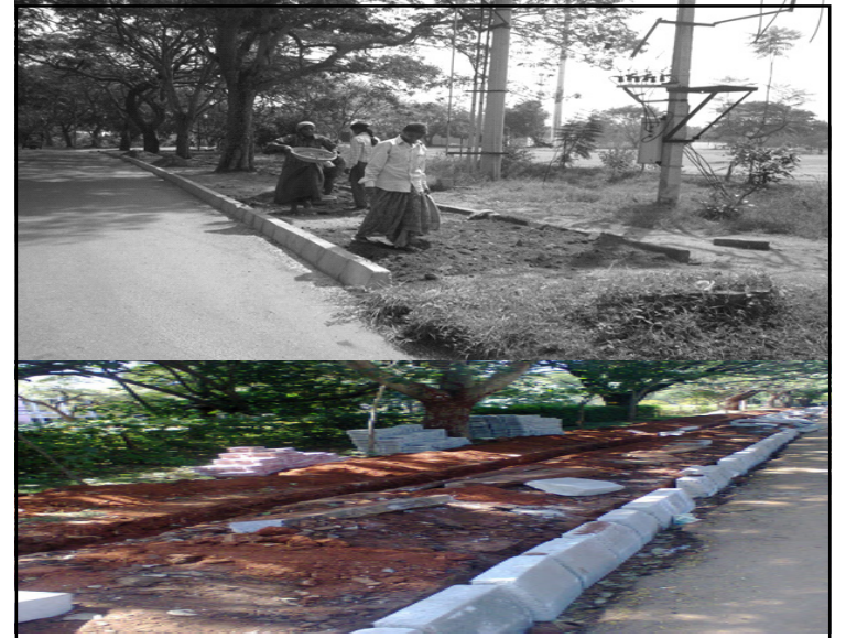
ಮಾನಸ ಗಂಗೋತ್ರಿಯಲ್ಲಿ ಪೂಟ್‌ಪಾತ್ ಮಾಡುವುದರಲ್ಲಿ ಕೆಲಸಗಾರರು ಮಗ್ನರಾಗಿರುವುದು.